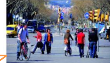
El passeig és una via molt transitada pels ciclistes.

El procés participatiu del projecte d'urbanització del passeig de Sant Joan, que pretén reformar el tram entre plaça Tetuan i l'Arc de Triomf, ja ha començat. Els veïns podran expressar la seva opinió i aportar idees sobre aquest projecte que té per objectiu convertir l'actual via en un passeig ampliant les voreres, amb noves línies d'arbres i d'edificament. S'han instal·lat quatre plafons informatius, en diferents punts del barri, perquè tots els veïns puguin veure la idea inicial del projecte i, a més, es podrà enviar un correu electrònic amb suggeriments i aportacions per aconseguir entre tots millorar el passeig de Sant Joan.