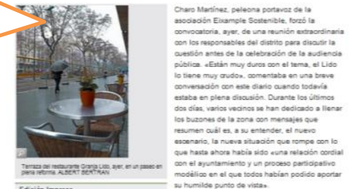
Terraza del restaurante Granja Lido, ayer, en un paseo en pena informó